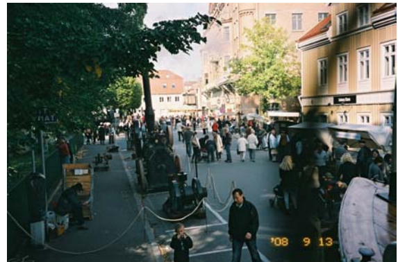
Vy över marknadsplatsen